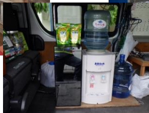
▶冷水・塩飴・乾燥梅