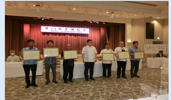
▶協会表彰 受賞者の方々