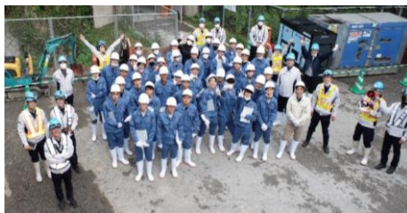
▶将来の建設業を担う高校生達と現場スタッフ