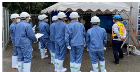
▶真剣に説明を聞く高校生達