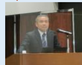
▶大里専務理事 講演