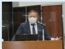
▶与那嶺支部長 挨拶

トラブルになった場合は①早期に暴追センター、警察に相談することが重要②相談すれば必ず前進する③事態が小さいうちに必ず相談すること、とセンターの利用を呼びかけました。