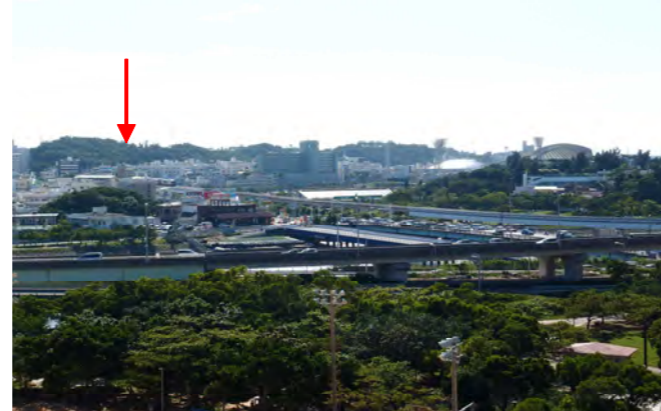
現在のガーナムイ