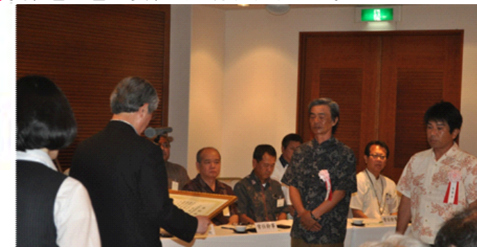
三好会長から表彰状と記念品を授与される

総会に先立って、協会功労者表彰のうち技能社員表彰者 2 名の表彰式が行われました。