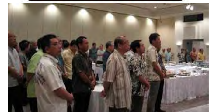
来賓の挨拶を聴く会場風景