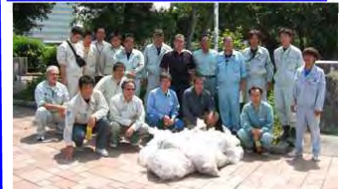
今日の成果! イマイチか?

第 93 回道路美化清掃活動を 5 月 20 日に実施しました。梅雨入りが宣言され、天気予報では雨の確率が 60%で実行が危ぶまれましたが、思い切って実施。何とか最後まで持ちこたえ、無事に終了しました。今回の参加者は 16 社・19 名でした。