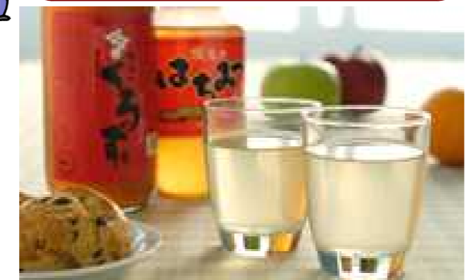
自作の黒酢ハチミツ飲料

【沖縄の妖怪 ガーナー森(ガーナムイ)】 沖縄県的那覇市にある伝説の森。かつては意思を持って動き回った。人を食ったり、畑を荒らしたりと悪さをしたため、土地の神様に封じられてしまった。[沖縄語] gana (ガーナー) たんこび