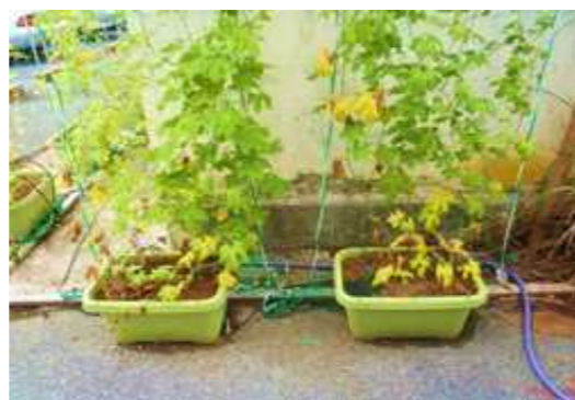
処理土壌の植生確認(ゴーヤ)

そこで当社は、県の開発事業に参加し、本土企業と協力することで微生物を利用した油汚染土壌の処理に成功しました。この技術は浄化できる物質に限りがありますが、運搬なしで現地処理ができること、また、処理後の土は栄養豊富な土として埋め戻せる等の利点があります。 この技術だけではなく、他の処理工法についても本土企業と連携しながら、米軍基地跡地の再開発に貢献していきたいと考えております。