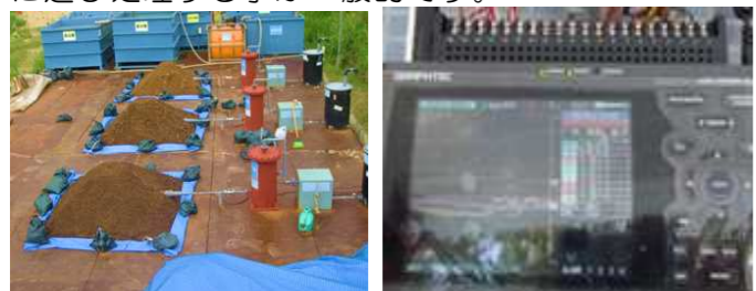
開発事業時の実証実験状況 処理中のデータ収集状況

会員の皆様 こんにちは。 当社は皆様のご支援のもと、おかげさまで創業 65 年を迎えることができました。 建設業を営む我々も、地域・社会に共存する一員として昨今の環境問題には積極的に取り組み、環境改善活動に励む毎日です。 そのような状況の中で、当社は今後の米軍基地跡地の土壤汚染浄化に、今までの土工事の経験と独自のネットワークを活かして貢献することを決意しました。 現在、県内で土壤汚染専用の処理施設はまだありません。従って、高額な運搬費等をかけて本土に運び処理する事が一般的です。