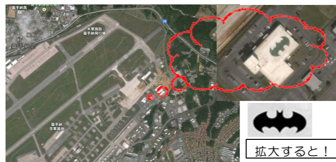
米軍施設、嘉手納飛行場