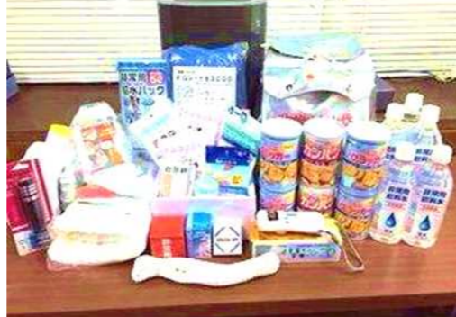
非常時に備え、必要なものを常備しましょう！

認したり、非常用備品の備蓄や管理、処方薬を服用している人は予備で持ち歩く、職場では個人的にも飲料水や飴、スニーカーなどを用意しておく