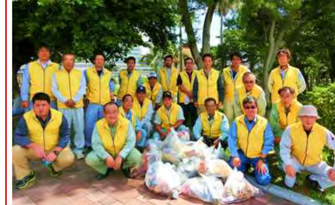
高齢者になる前の皆さんが参集！

全国で 65 歳以上の老人が 4 人にひとりとなる高齢化社会。高齢者が健康で自立した生活を過ごせるよう、地域社会、家族の協力が必要になります。