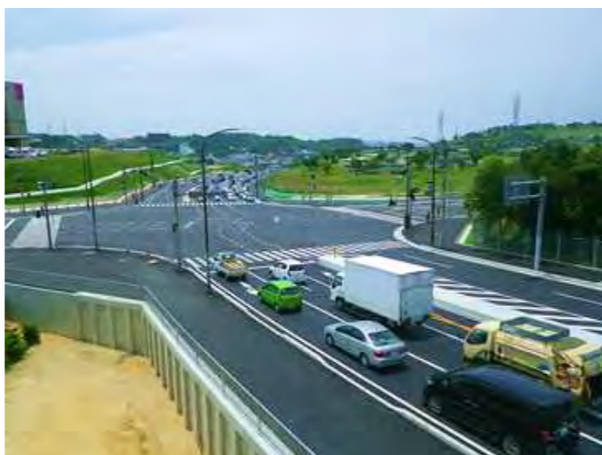
完成後のライカム交差点！ライカム（Rycom）は、かつての琉球米軍司令部（Ryukyu Command headquarters）の略称