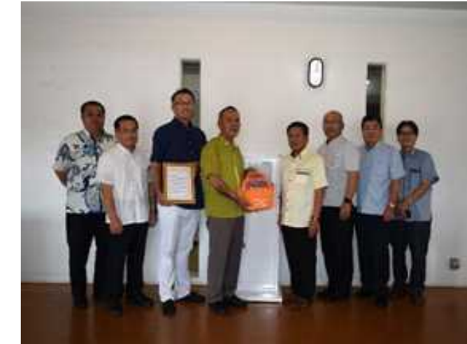
副市長、支部長を中央に出席者で記念撮影

AEDの贈呈が行われた後、糸満市、道建協沖縄支部の関係者で記念撮影を行い和やかなうちに贈呈式は閉会となりました。