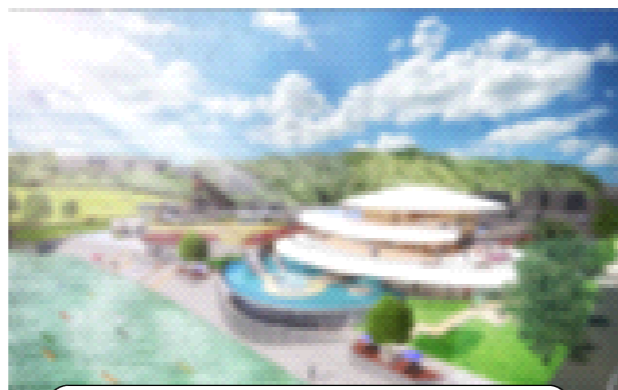
道の駅ぎのざ【観光センター】!完成予想図

結されたカヌー乗り場も併設されております。ダム下流のマングローブ林や海岸線、湾内でのカヌー遊覧を満喫し、おおいに楽しめる施設が、まもなくオープンします。山原の自然や海を楽しみたい方、北部へおでかけの方は、ぜひお立ち寄りください。