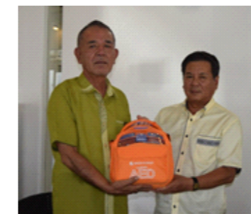
左が金城副市長、右が与那嶺支部長