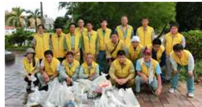
雨にも負けず集めたゴミを前にして!

途中、突然雨が降り出し雨宿りをしながらの作業になりましたが無事終了することが出来ました。参加者の皆様有難うございました。