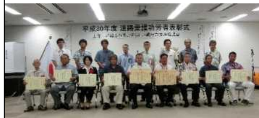
受賞者の皆さんで記念撮影