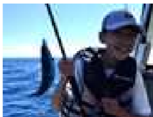
沖縄県の県魚「グルクン」 正式名称「タカサゴ」