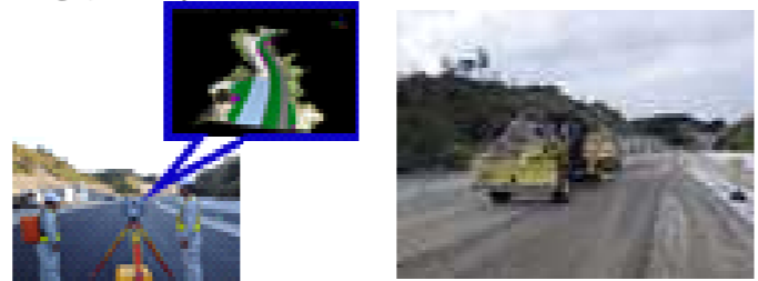
レーザースキャナー 出来形測量

ータグレーダによる施工、出来形管理、検査書類の作成、電子納品を行いました。 施工においては、従来の丁張り設置がなくなり、現場管理業務の軽減、MCモータグレーダの位置情報により設計縦横断勾配を効率的に仕上げ、表層平坦性1.0mmで良好でした。 ICTを全面活用したことで現場管理業務と施工の生産性が向上し、円滑に工事を完成することができました。