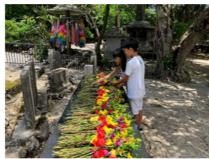
「ひめゆり学徒隊」の慰霊塔 「ひめゆりの塔」

で子供達も目をキラキラとさせていました。 今回彼らが遊びに来たことで思うところは、小学生がちょっとした冒険みたいに飛行機に乗って沖縄に行けること、ずいぶん沖縄が身近になったなと思います。 まだまだ魅力いっぱいこの島に、子供達はまた来たがっております、まだまだ満喫させて頂こうと思います。