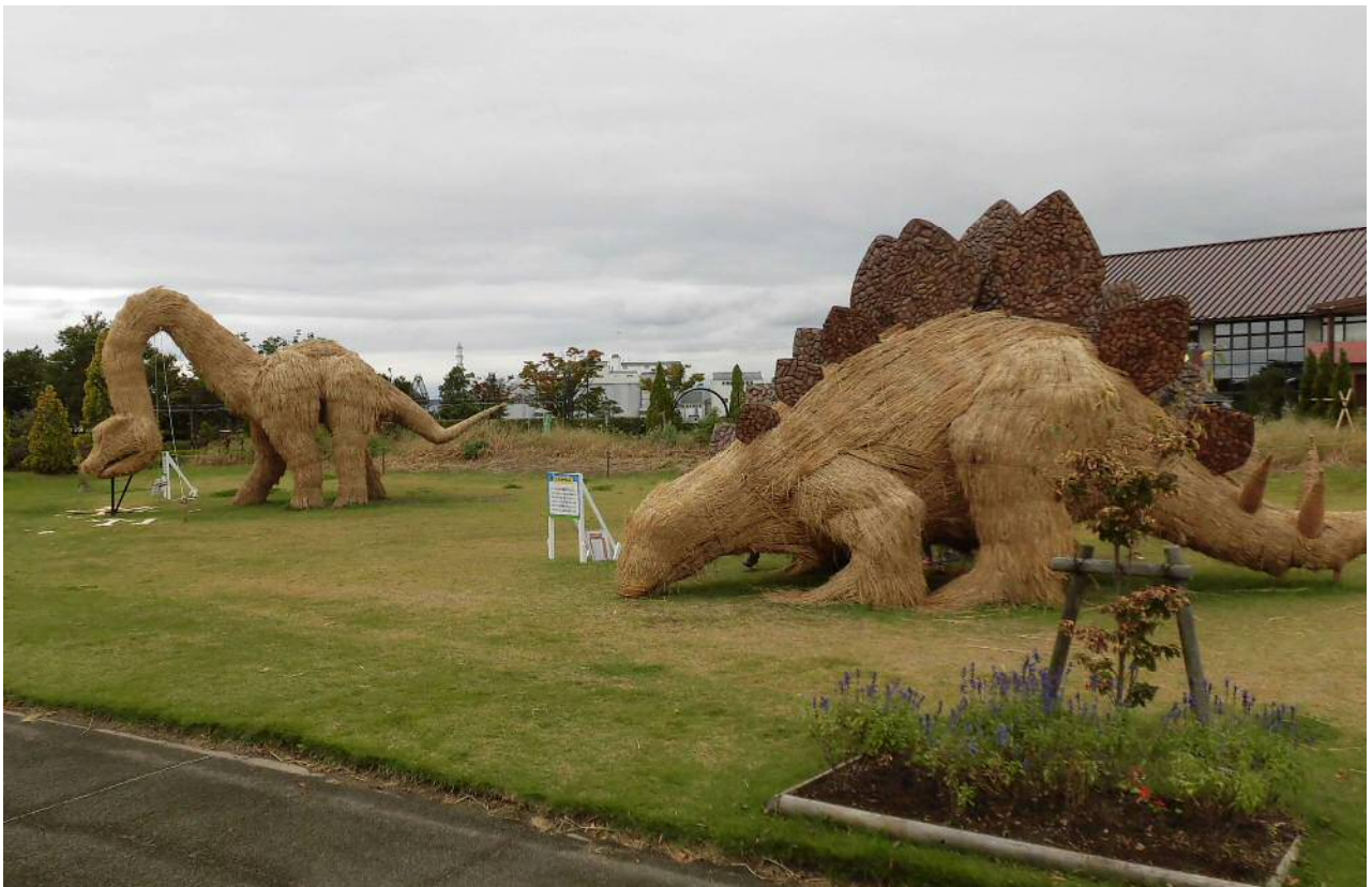
(仙台市農業園芸センター H29. 9. 23)