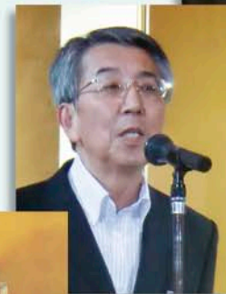
川端副会長の挨拶