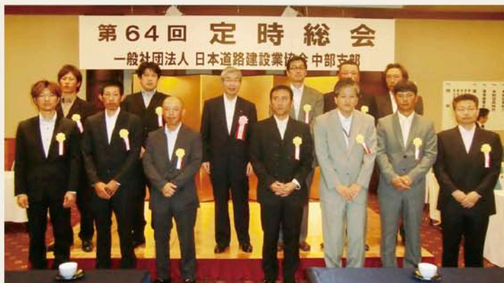
技能社員表彰受賞者

平成24年度の事業計画としては、舗装施工管理技術者講習会の実施、中部地方整備局や中日本高速道路(株)との意見交換会開催、年6回の安全パトロールの実施、防災体制の強化、道路建設技術講演会の開催などの活動を挙げました。