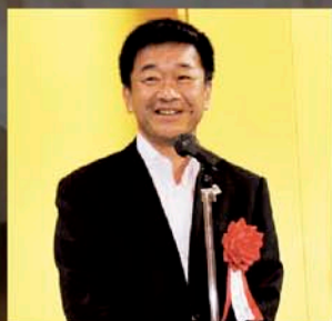
中部地方整備局 足立局長のご挨拶