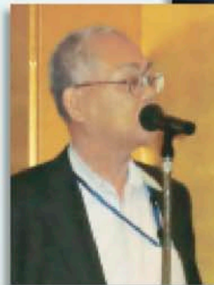
寺林副会長の挨拶