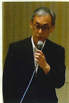
中部地方整備局 塚原局長