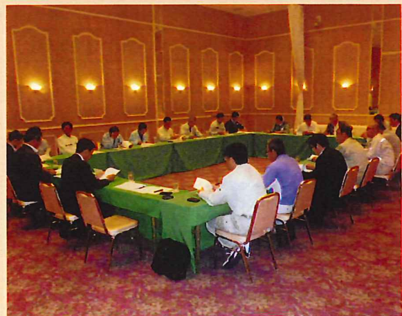
三重地区合同 班員会議