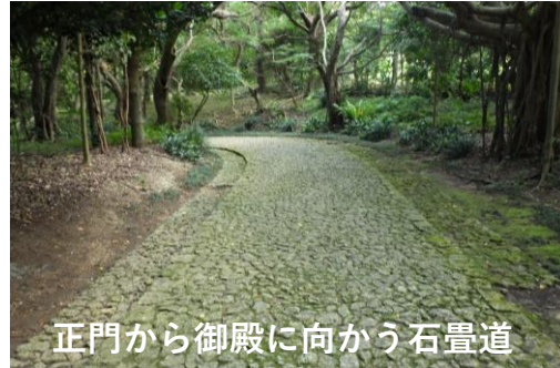
正門から御殿に向かう石畳道

(大広間)、それに連なる二番座、三番座など15もの部屋が見学出来ます。庭園に目を向けると、池のまわりを歩きながら景色を楽しむ「廻遊式庭園」になっています。中国風のあずまやも配され、琉球、中国、日本の文化をチャンプルーした独特な雰囲気を楽しめます。琉球の文化を体験し、微力ながら沖縄の発展に寄与したいと存じますので、今後ともご指導の程、宜しくお願い致します。