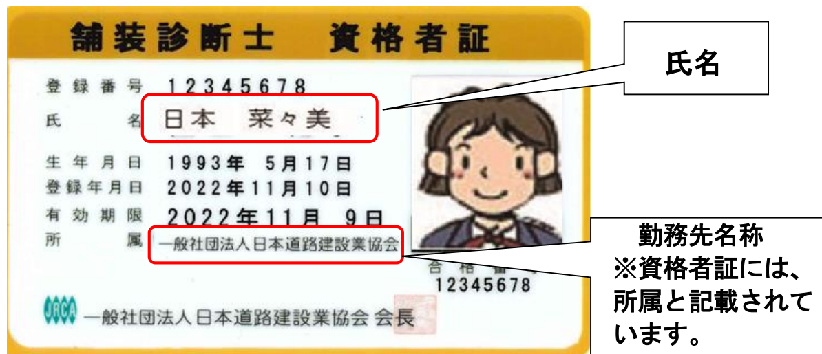
図-1 資格者証に記載のある登録事項

なお、 氏名および所属 の漢字が外字・俗字等の場合、パソコン対応漢字（JIS第1水準、第2水準まで）にて記載致しますので、ご了承下さい。