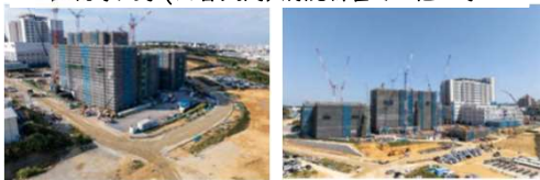
▶琉球大学(西普天間)医学部関係施設整備事業