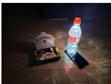
▶スマホライトにペットボトル置くと明るくなります

弊社の事業所はいわゆる都心ではないので、通信環境の完全復旧に3週間を要しました。NTTの作業班は何と!札幌からの応援部隊でした。