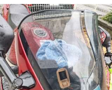
▶我が愛馬の無残な姿・・・