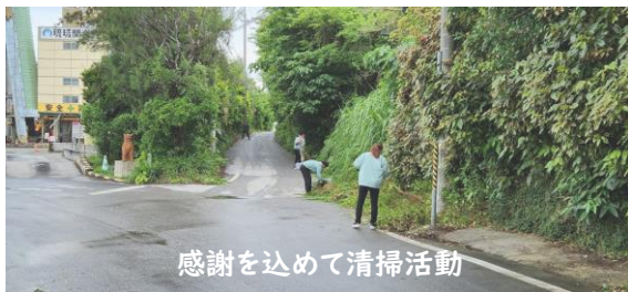
感謝を込めて清掃活動

見通しが悪く危険と言う事ももちろんですが、お世話になっている地域や土地にも、この地で仕事をさせてもらっている、と言う感謝を込めて実施しています。