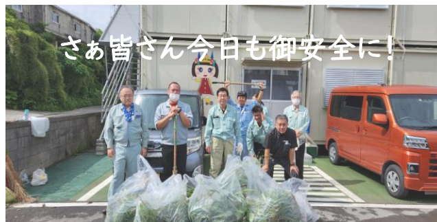
さあ皆さん今日も御安全に!

目の前の出来る事から行き、『道を作る』と言う仕事に誇りを持ち、県民の皆様から愛される道を作って行きます。さあ皆さん今日も御安全に!