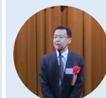
中原部長 来賓挨拶