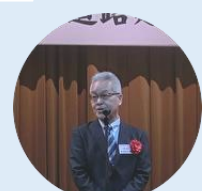
眞栄里技術企画官 乾杯挨拶