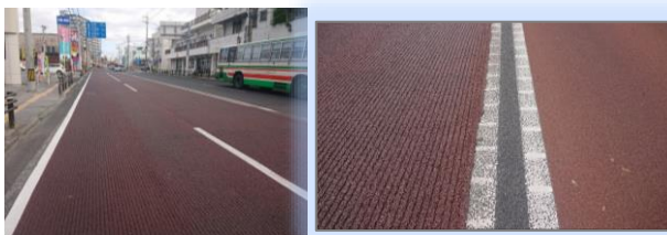
那覇市上間 国道329号