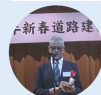
前川部長 来賓挨拶