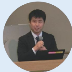
関 企画調整官 講演

の4項目で、資料を基に詳細にご講演頂き、参加者はメモを取るなど熱心に聞き入っていました。