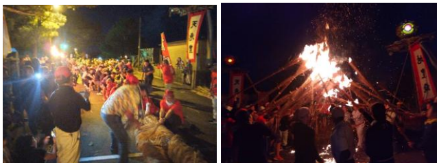
宜野座区大綱引き

ともに前組(メーグミ)後組(クシグミ)に分かれ、全区民が力強く綱を引き寄せました。弊社もこのような地域行事に積極的にに関わり、地域を盛り上げることで、地域の未来づくりに貢献してまいりたいと存じます。