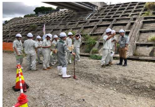
ワンマン測量機器体験