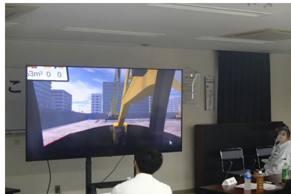
VRを使った重機の操作体験