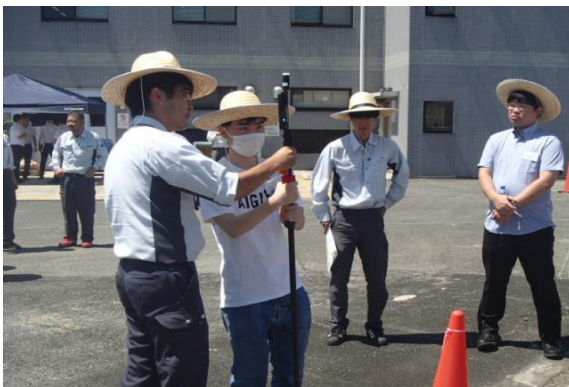
初めて触れる測量道具におっかなびっくり