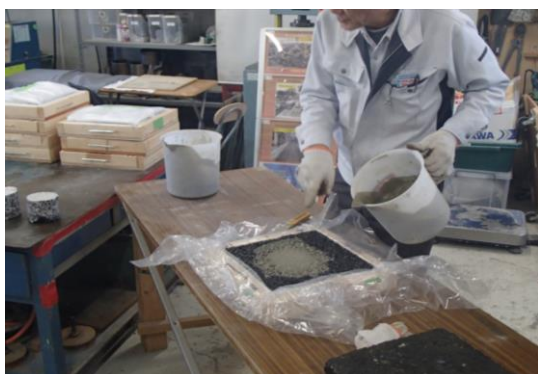
小さいモデルを作って半たわみ性舗装の説明