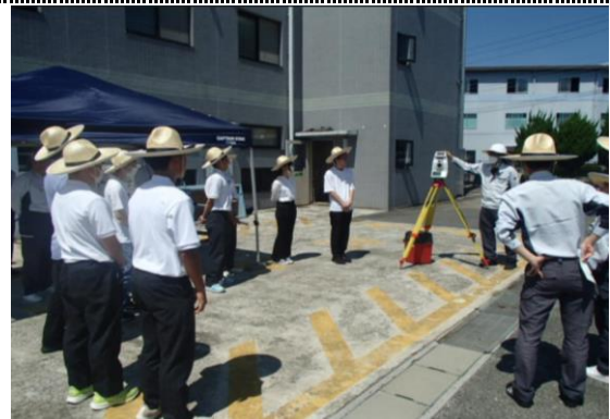
レーザースキャナを使って実際に測量します