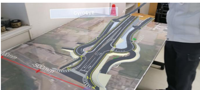
測量したデータを基にVRで完成図を確認