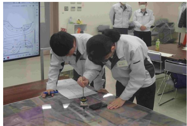
先輩社員と共にミニチュアを使った測量