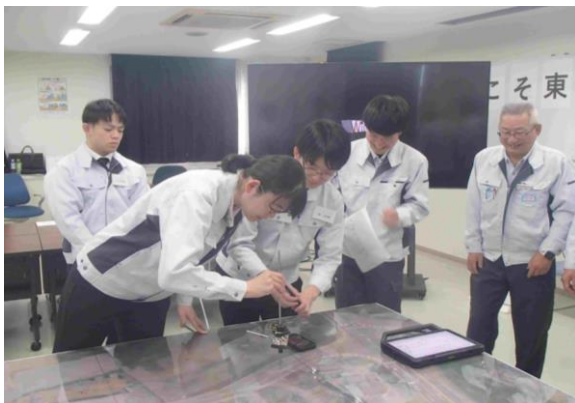
先輩社員と共にミニチュアを使った測量