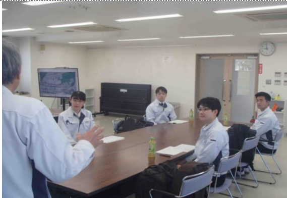
伊藤生産技術本部長による座学講義