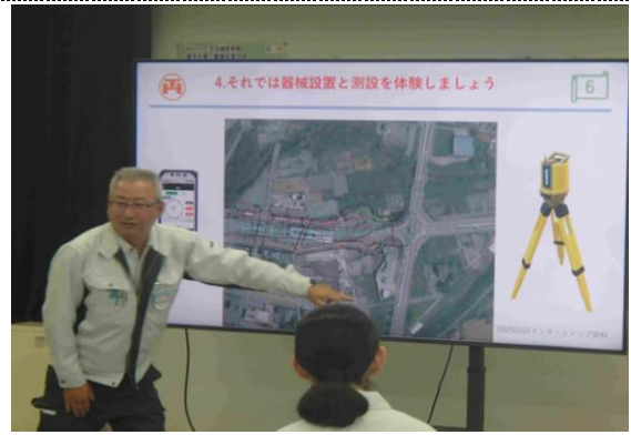
測量についての座学