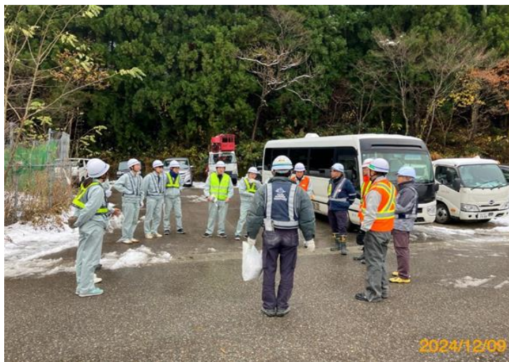
現場概要説明・質疑応答